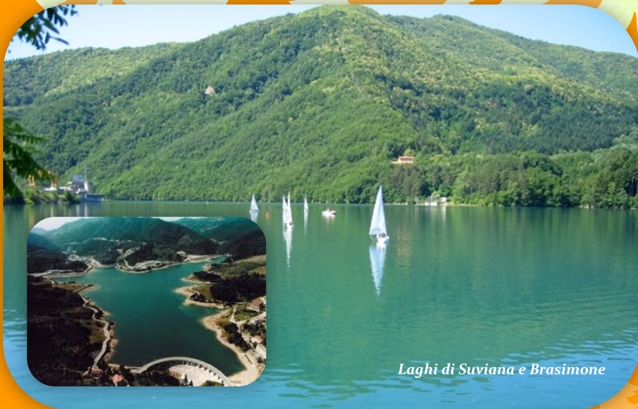
Laghi di Suviana e Brasimone

Tutto quanto non espressamente indicato in "La quota include".